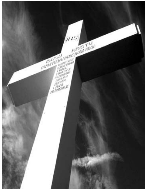
Ti saluto, o croce santa, che portasti il Redentor!

Accogliamo il desiderio di Maria perché Lei ci avvicini al Suo Cuore Immacolato dove troveremo rifugio e pace, dove fiorisce quel Sì timoroso ma forte, umile eppur consapevole, capace di portare Dio nell'uomo. Preghiamo perché il Suo Sì diventi il nostro sì perché nel Suo Cuore Immacolato possiamo essere assimilati a Gesù e di Lui essere portatori nel mondo, mani tese di Maria. Come potrà accadere questo? Lo Spirito Santo scenderà su di te e la potenza dell'Altissimo ti coprirà con la Sua ombra (cfr Lc 1, 34-35) e porteremo in noi Gesù nell'attesa del Suo ritorno. Pace e gioia in Gesù e Maria. §