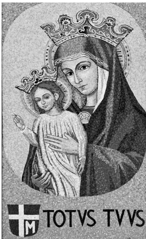
Mater Ecclesiae, Piazza San Pietro, Vatican, Mosaïque souhaitée par Jean-Paul II

Ce qui est autour de nous nous conduit vers les choses terrestres, mais Elle désire nous conduire vers le temps de grâce. Devant ce qui a peu ou aucune valeur, Marie oppose ce qui est proche de nous, voire même très proche, et que nous pourrions laisser tomber sans en recueillir les bénéfices divins; ce temps de grâce est le Temps de l'Avent, le temps propice à accueillir Jésus dans notre cœur et notre âme. Un enfant est né pour nous, un fils nous a été donné, chante le Prophète (Is 9, 5a). Pour que Noël ne soit pas un